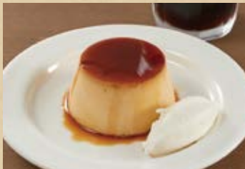
本和香糖の焼きプリン Baked Pudding