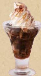
コーヒーゼリー パフェ Coffee Jelly Parfait