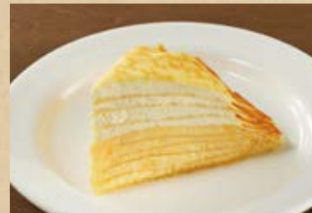
ミルクレープ Mille Crepe