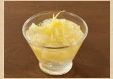
土佐文旦のゼリー Tosa Pomelo Jelly