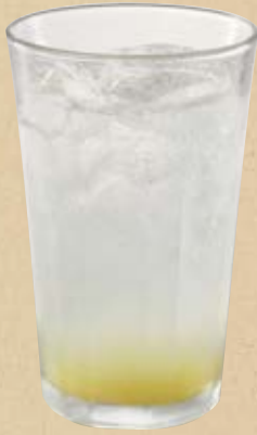
檸檬のサイダー Lemon Cider

檸檬の果汁をたっぷり使ったピューレと、やさしい甘さのサイダーと合わせました。すっきりとした後味が特長です。