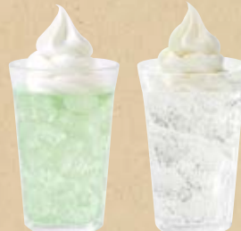
メロンクリームソーダ クリームサイダー Melon Ice Cream Soda Ice Cream Cider