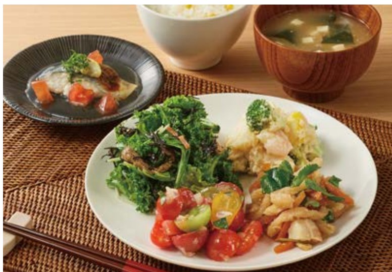
写真は「選べるメインと4品デリセット」の盛り付け例です