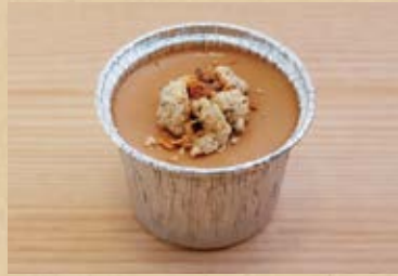
特選ほうじ茶の焼きプリン Special roasted green tea pudding

茶寮つぼり製茶本舗の特選ほうじ茶の香を楽しむプリンに仕上げました。茶葉も余すことなく使用しています。