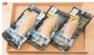
い さわらの袖庵漬