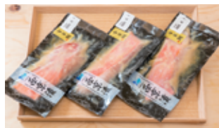
あ 金目鯛の西京漬