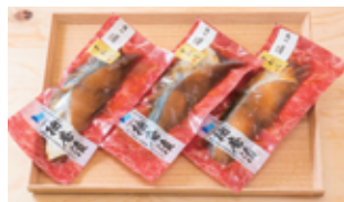
う カラスガレイの西京漬