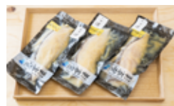
い さわらの柚庵漬