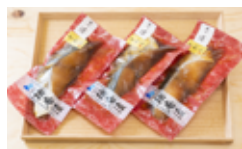
う カラスガレイの西京漬