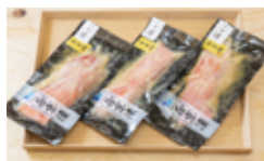
あ 金目鯛の西京漬