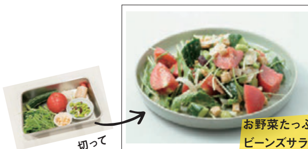
お野菜たっぷり ビーンズサラダ