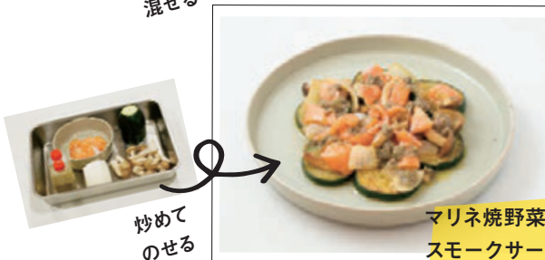
マリネ焼野菜と スモークサーモン