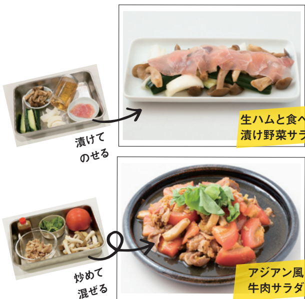
生ハムと食べる 漬け野菜サラダ