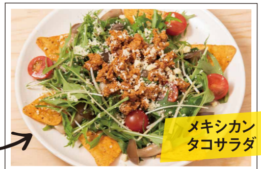
メキシカン タコサラダ