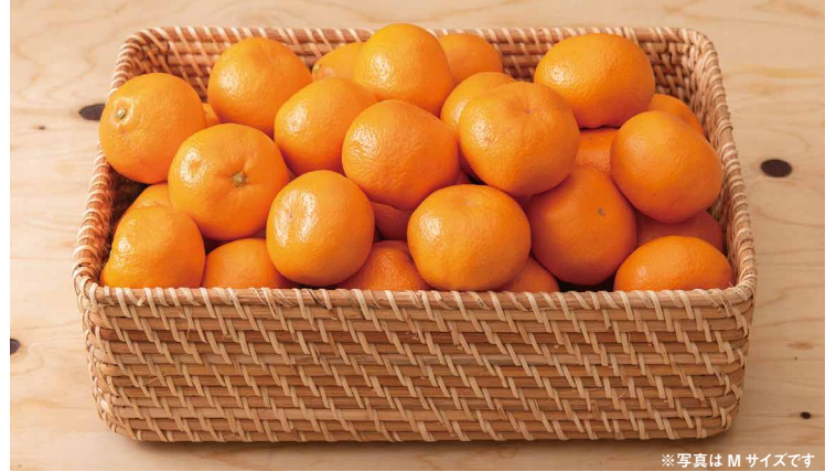
※写真はMサイズです