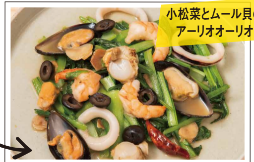
小松菜とムール貝の アーリオオーリオ