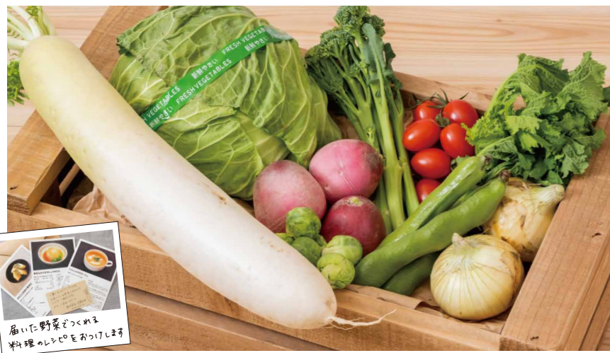
※写真は3~5人家族向けセットの一例です