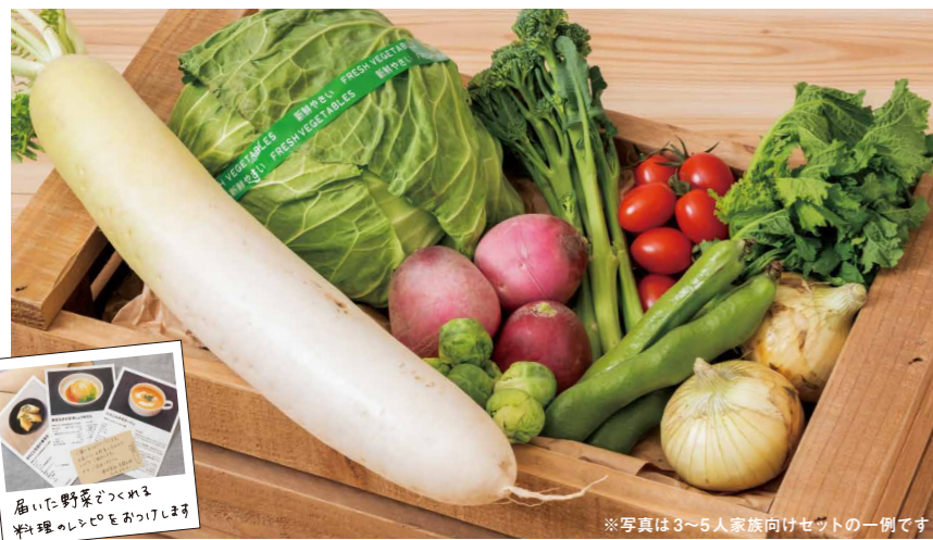
※写真は3〜5人家族向けセットの一例です