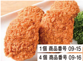
1個 商品番号 09-15 4個 商品番号 09-16