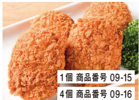
1個 商品番号 09-15