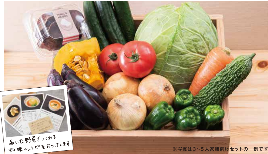
※写真は3~5人家族向けセットの一例です