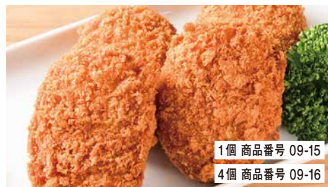
1個 商品番号 09-15