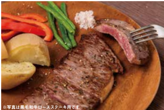
※写真は黒毛和牛ロースステーキ用です