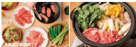
※写真は調理例です