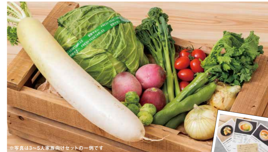
※写真は3~5人家族向けセットの一例です

2023年1月中旬より、一部商品の価格を変更する場合がございます。価格を変更した商品に関しましては、お電話口にてお伝えさせていただきます。予めご了承くださいませようお願い申し上げます。