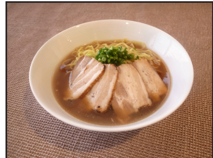
自家製チャーシュー麺