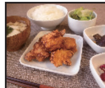
塩麴のからあげ定食