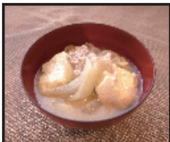
たちばなさんに教わった とん汁