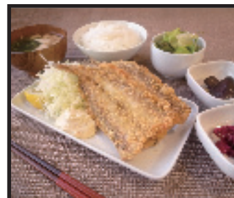
季節のおさかな定食